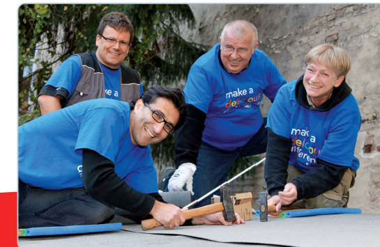
Mitarbeitende eines Unternehmens bei einem ehrenamtlichen Einsatz

Mehr Informationen und Beispiele finden Sie unter www.caritas-unternehmenskooperationen.de